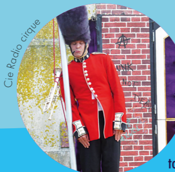
Cie Radio cirque

ILS SERONT LÀ OÙ VOUS NE LES ATTENDEZ PAS !